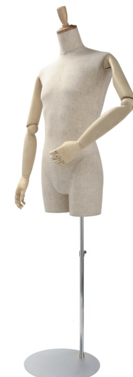
SGB007P-1C 芯地 Arm: SK0010-2 Head: H-57 クリア Base: 専用丸スタンド 高さ: 90 B: 94 W: 75 H: 91 肩幅 54.5