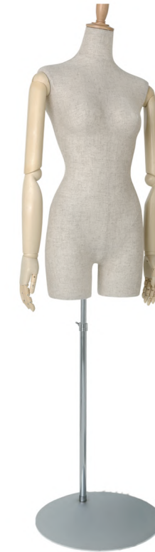
SLB003P-1C 芯地 Arm: SK0011-2 Head: H-53 クリア Base: 専用丸スタンド 高さ: 81 B: 82 W: 57 H: 85 肩幅 47