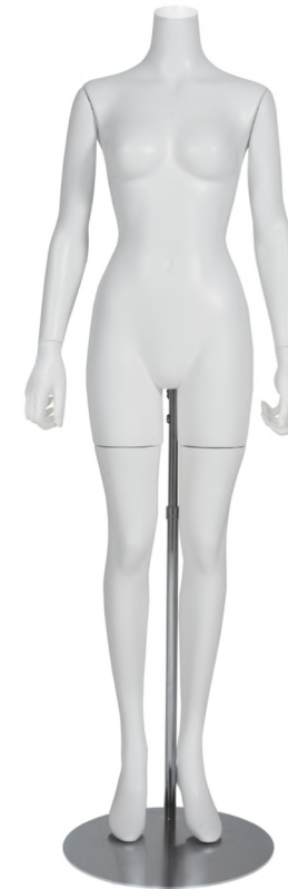
SLB002K-1W-RL ラッカー (白) Arm: 右直・左直 Head: なし Base: 専用丸スタンド 高さ: 157 B: 82 W: 57 H: 85 肩幅 42