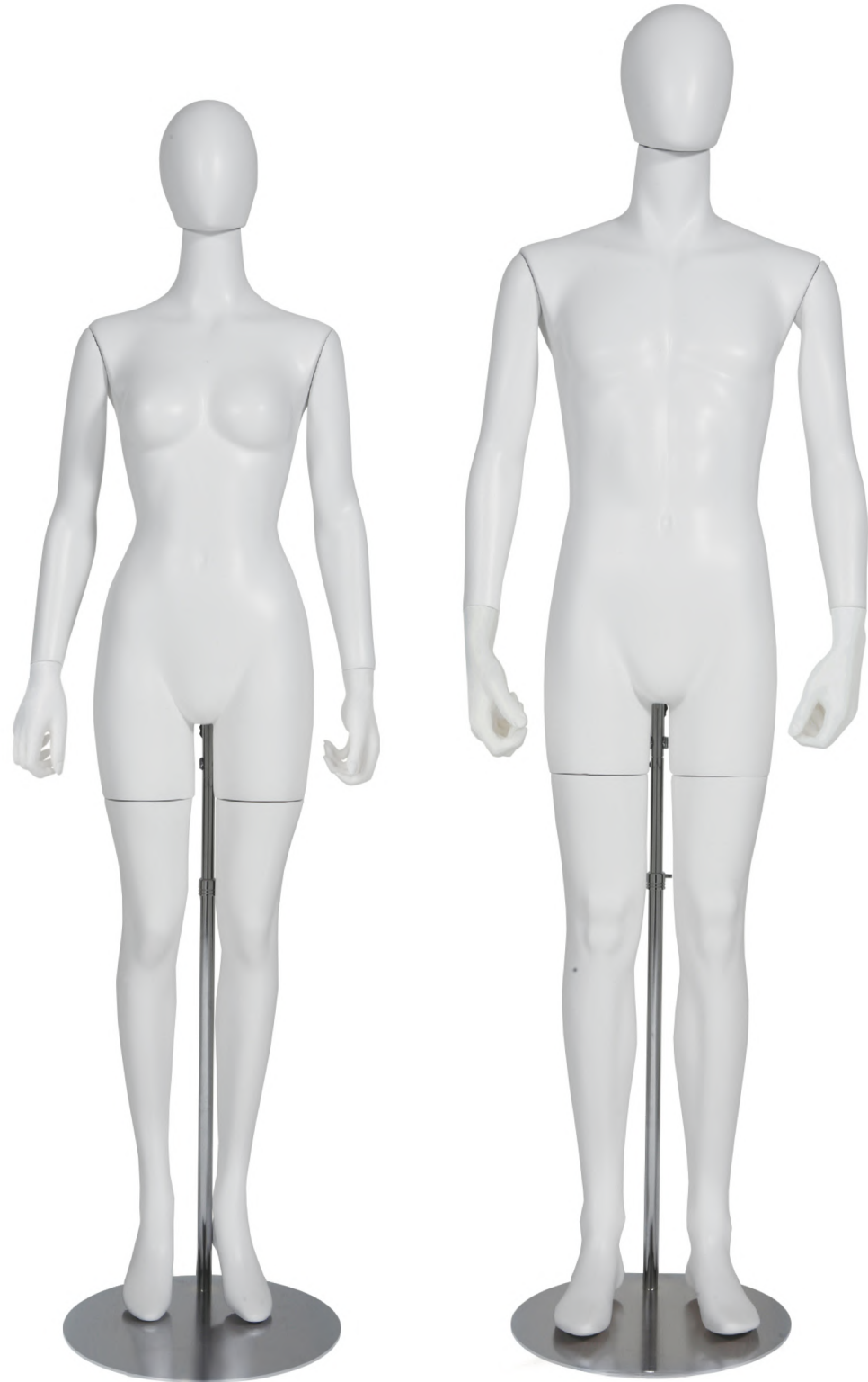
SLB002K-1W-H-RL ラッカー (白) Arm: 右直・左直 Head: オーバルヘッド Base: 専用丸スタンド 高さ: 176 B: 82 W: 57 H: 85 肩幅 42

美しく進化し続けるバックスタンドボディに、オーバル型ヘッドとリアルレッグをプラス。 フェイスアイテムからレッグアイテムまで、ファッションブルかつ機能的にコーディネートできるように追究いたしました。