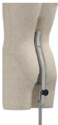
バックスタンド構造 傾き調整機能付き