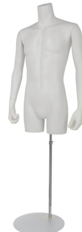
SGB005K-1W ラッカー (白) Arm: 右直・左直 Head: なし Base: 専用丸スタンド 高さ: 91.5 B: 94.5 W: 76 H: 91 肩幅 50