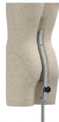
バックスタンド構造 傾き調整機能付き