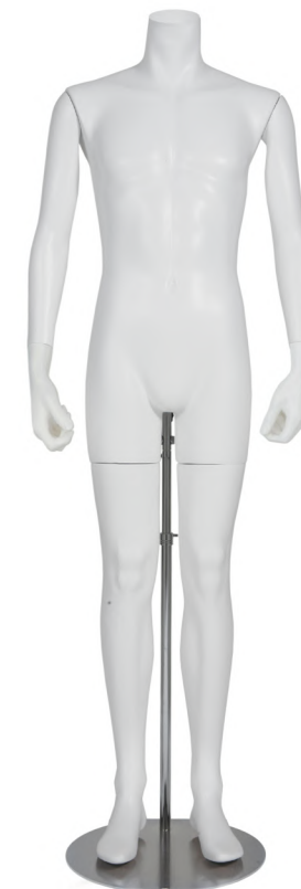
SGB006K-1W-RL ラッカー (白) Arm: 右直・左直 Head: なし Base: 専用丸スタンド 高さ: 169 B: 94.5 W: 76 H: 91 肩幅 50