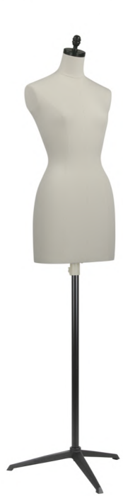
SL0895A-1KA カツラギ Head:H-101アンティークアップ ラックφ8.4 Base:B-205 黒 B:81 W:58 H:85 高さ:79 肩幅:38