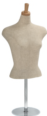
SL0350A-2C 本芯地 Head:H-27クリアφ7.5 Base:B-16B Arm:なし B:82 W:58 高さ:52.5 肩幅:41