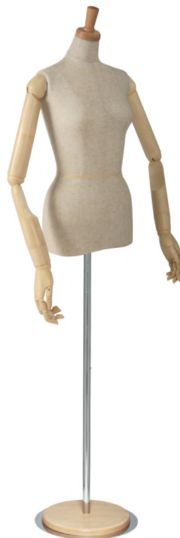
SL0530P-1C 本芯地 Head:H-27クリアφ7.5 Base:B-8クリア Arm:SK0060-2 アイボリー B:80 W:58.5 H:82.5 高さ:65 肩幅:40.5