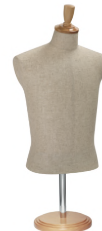
SG0980A-2C 芯地 Arm: なし Head: H-57 クリア Base: B-61 クリア S 高さ:60 B:89 W:77 肩幅 43 M 高さ:60 B:93 W:80 肩幅 44 L 高さ:60 B:95 W:81 肩幅 46