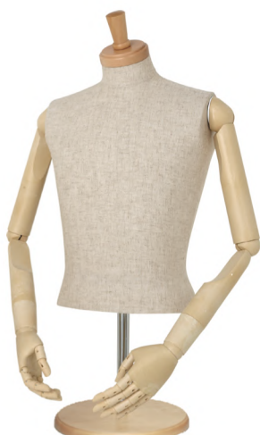
SG0630P-2C 本芯地 Head:H-30クリアφ10.5 Base:B-43クリア Arm:SK0050-2アイボリー B:92 W:75 高さ:55 肩幅:46.5