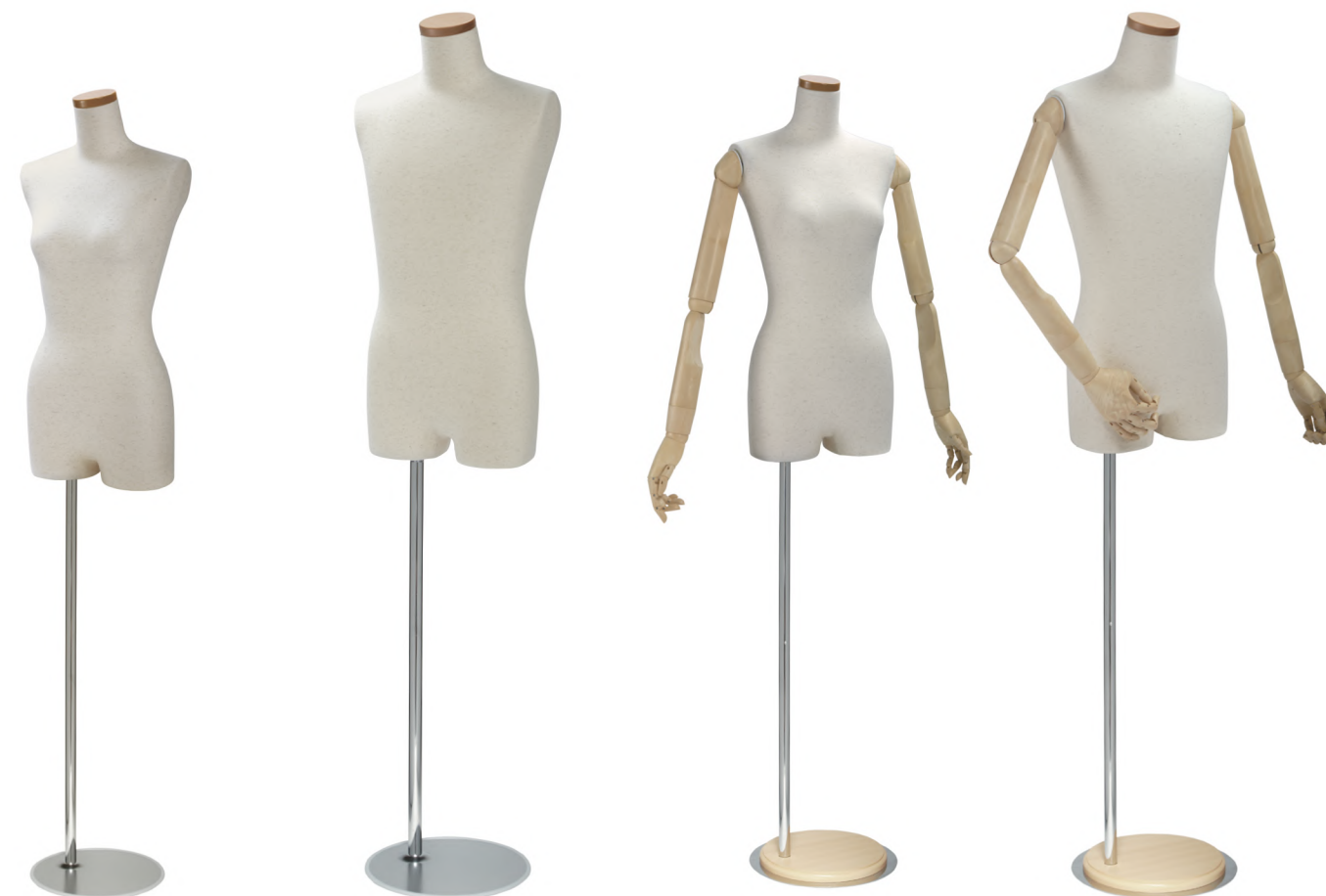
SL0850A-1N 芯地ニット Arm: なし Head: H-63 クリア Base: B-59 S 高さ :72 B:77 W:56 H:81.5 肩幅 34.5 M 高さ :76 B:82 W:61 H:85 肩幅 38 L 高さ :76 B:88 W:67.5 H:91.5 肩幅 40