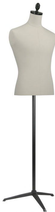
SG0995A-1KA カツラギ Head:H-100 アンティークアップ ラックφ10.2 Base:B-205 黒 B:96 W:75 H:93 高さ:74 肩幅:44