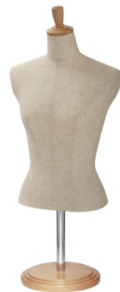
SL0880A-2C 芯地 Arm: なし Head: H-53 クリア Base: B-61 クリア S 高さ:55 B:77 W:57 肩幅 38.5 M 高さ:56 B:81 W:61 肩幅 39.5 L 高さ:57 B:82 W:63 肩幅 40