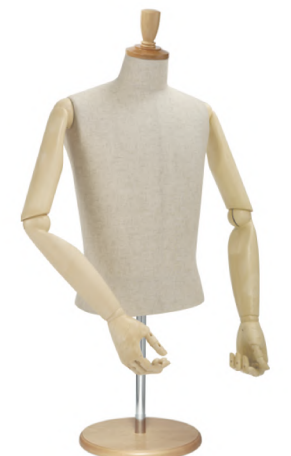
SG0983P-2C 芯地 Arm: SK0010-2 Head: H-57 クリア Base: B-43 クリア S 高さ:60 B:89 W:77 肩幅 43 M 高さ:60 B:93 W:80 肩幅 46 L 高さ:60 B:95 W:81 肩幅 46