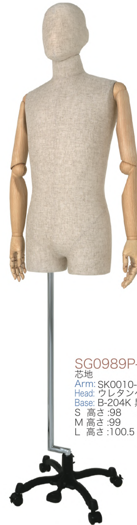
SG0989P-1C 芯地 Arm: SK0010-4(ウッドプリント) Head: ウレタンヘッド 芯地 Base: B-204K 黒 S 高さ:98 B:89 W:77 H:93 肩幅 43 M 高さ:99 B:93 W:80 H:94 肩幅 46 L 高さ:100.5 B:95 W:81 H:95 肩幅 46