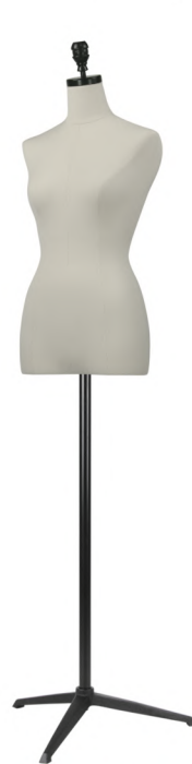
SL7002A-1KA カツラギ Head:H-114 黒φ8.2 Base:B-205 黒 B:79 W:57.5 H:88 高さ:67.5 肩幅:37