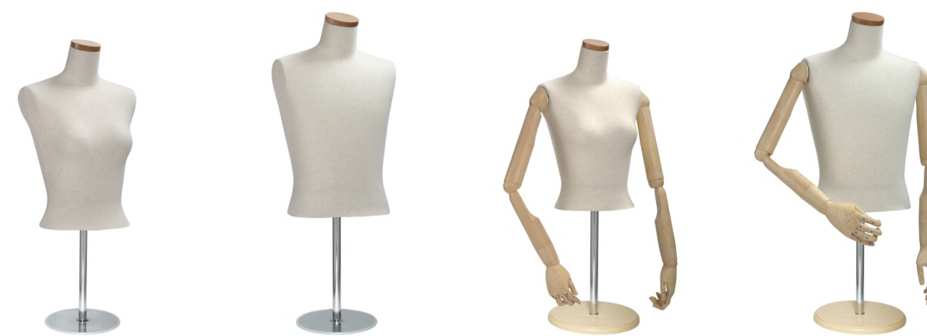
SL0850A-2N 芯地 Arm: なし Head: H-63 クリア Base: B-16B S 高さ :53 B:77 W:56 肩幅 34.5 M 高さ :56 B:82 W:61 肩幅 38 L 高さ :56 B:88 W:67.5 肩幅 40