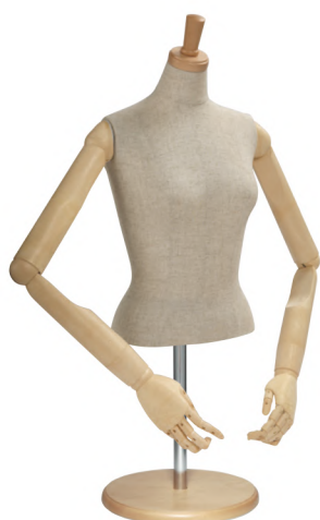
SL0530P-2C 本芯地 Head:H-27クリアφ7.5 Base:B-43クリア Arm:SK0060-2 アイボリー B:80 W:58.5 高さ:52 肩幅:40.5