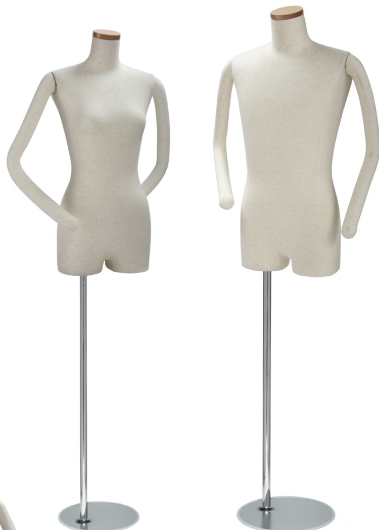
SL0850F-1N 芯地ニット Arm: ラウンドフレキ腕 Head: H-63 クリア Base: B-59 S 高さ :72 B:77 W:56.0 H:81.5 肩幅 40.5 M 高さ :76 B:82 W:61.0 H:85.0 肩幅 44 L 高さ :76 B:88 W:67.5 H:91.5 肩幅 46