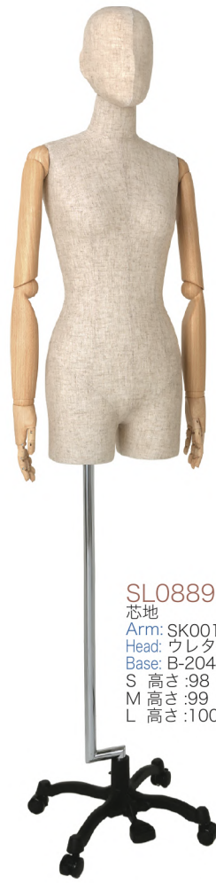
SL0889P-1C 芯地 Arm: SK0011-4(ウッドプリント) Head: ウレタンヘッド 芯地 Base: B-204K 黒 S 高さ:98 B:77 W:57 H:84.5 肩幅 39 M 高さ:99 B:81 W:61 H:86.5 肩幅 40 L 高さ:100 B:83 W:63 H:89 肩幅 41