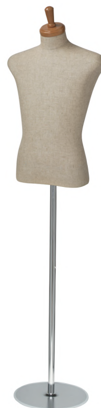
SG0410A-1C 本芯地 Head:H-30クリアφ10.5 Base:B-26 Arm:なし B:92 W:77 H91 高さ:68.5 肩幅:47