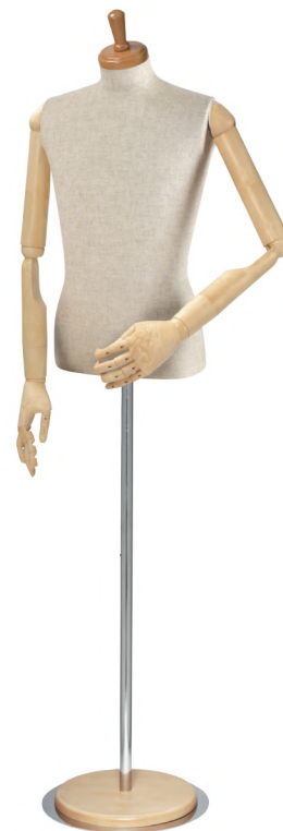
SG0630P-1C 本芯地 Head:H-30クリアφ10.5 Base:B-8クリア Arm:SK0050-2アイボリー B:92 W:75 H90 高さ:67 肩幅:46.5