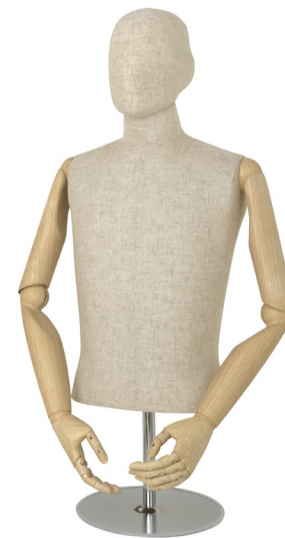
SG0989P-2C 芯地 Arm: SK0010-4(ウッドプリント) Head: ウレタンヘッド 芯地 Base: B-46 S 高さ:77 B:89 W:77 肩幅 43 M 高さ:77.5 B:93 W:80 肩幅 46 L 高さ:78 B:95 W:81 肩幅 46