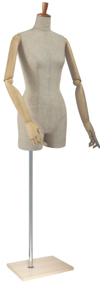
SL0883P-1C 芯地 Arm: SK0011-2 Head: H-53 クリア Base: B-94 クリア S 高さ:78 B:77 W:57 H:84.5 肩幅 39 M 高さ:79 B:81 W:61 H:86.5 肩幅 40 L 高さ:80 B:83 W:63 H:89 肩幅 41