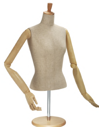
SL0883P-2C 芯地 Arm: SK0011-2 Head: H-53 クリア Base: B-43 クリア S 高さ:55 B:77 W:57 肩幅 39 M 高さ:56 B:81 W:61 肩幅 40 L 高さ:57 B:83 W:63 肩幅 41