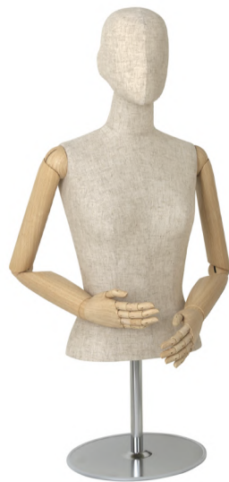
SL0889P-2C 芯地 Arm: SK0011-4(ウッドプリント) Head: ウレタンヘッド 芯地 Base: B-46 S 高さ:75 B:77 W:57 肩幅 39 M 高さ:76 B:81 W:61 肩幅 40 L 高さ:77 B:83 W:63 肩幅 41