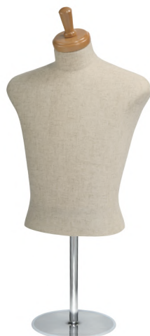
SG0410A-2C 本芯地 Head:H-30クリアφ10.5 Base:B-16B Arm:なし B:92 W:77 高さ:54.5 肩幅:47