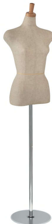
SL0350A-1C 本芯地 Head:H-27クリアφ7.5 Base:B-26 Arm:なし B:82 W:58 H:85 高さ:64.5 肩幅:41