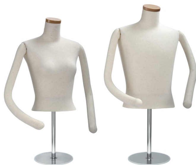
SL0850F-2N 芯地ニット Arm: ラウンドフレキ腕 Head: H-63 クリア Base: B-16B S 高さ :53 B:77 W:56.0 肩幅 40.5 M 高さ :56 B:82 W:61.0 肩幅 44 L 高さ :56 B:88 W:67.5 肩幅 46