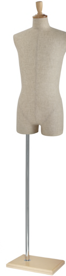
SG0980A-1C 芯地 Arm: なし Head: H-57 クリア Base: B-63 クリア S 高さ:80 B:89 W:77 H:93 肩幅 43 M 高さ:81.5 B:93 W:80 H:94 肩幅 44 L 高さ:82 B:95 W:81 H:95 肩幅 46