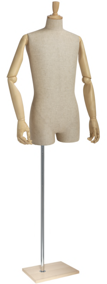
SG0983P-1C 芯地 Arm: SK0010-2 Head: H-57 クリア Base: B-94 クリア S 高さ:80.5 B:89 W:77 H:93 肩幅 43 M 高さ:81.5 B:93 W:80 H:94 肩幅 46 L 高さ:82 B:95 W:81 H:95 肩幅 46