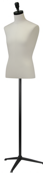
SG7022A-1KA カツラギ Head:H-116 黒φ10.2 Base:B-205 黒 B:91 W:73 H:91 高さ:68 肩幅:44