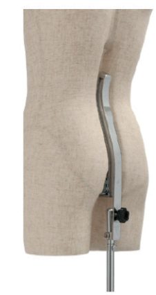
バックスタンド構造 傾き調整機能付き