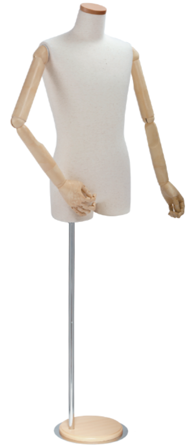
SG0950P-1N 芯地ニット Arm: SK0050-2 アイボリー Head: H-64 クリア Base: B-9P アイボリー S 高さ:76.5 B:85.0 W:71.0 H:84.0 肩幅 46.0 M高さ:81.5 B:94.0 W:76.5 H:91.5 肩幅 49.0 L 高さ:83.0 B:97.0 W:77.0 H:92.5 肩幅 51.0