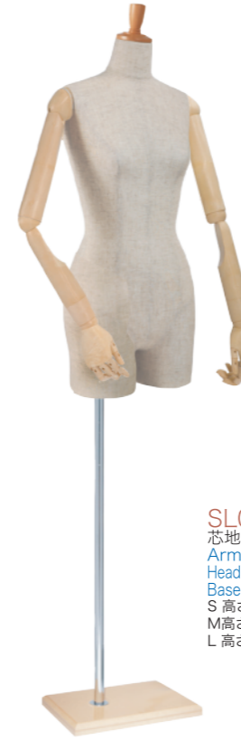
SL0883P-1C 芯地 Arm: SK0060-2 アイボリー Head: H-53 クリア Base: B-63 クリア S 高さ:78.0 B:77.0 W:57.0 H:84.5 肩幅 39.0 M 高さ:79.0 B:81.0 W:61.0 H:86.5 肩幅 40.0 L 高さ:80.0 B:83.0 W:63.0 H:89.0 肩幅 41.0