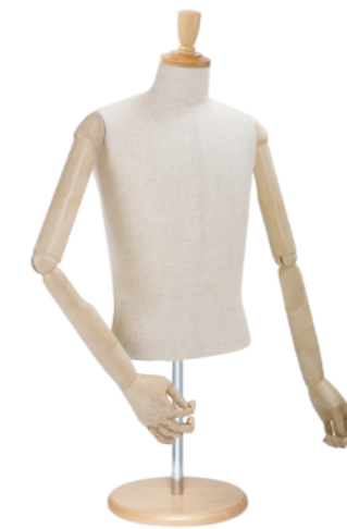
SG0983P-2C 芯地 Arm: SK0050-2 アイボリー Head: H-57 クリア Base: B-43P アイボリー S 高さ:59.0 B:89.0 W:77.0 肩幅 43.0 M 高さ:59.5 B:93.0 W:80.0 肩幅 46.0 L 高さ:60.0 B:95.0 W:81.0 肩幅 46.0