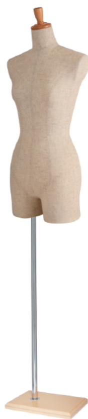
SL0880A-1C 芯地 Arm: なし Head: H-53 クリア Base: B-63 クリア S 高さ:78.0 B:77.0 W:57.0 H:84.5 肩幅 38.5 M 高さ:79.0 B:81.0 W:61.0 H:86.5 肩幅 39.5 L 高さ:80.0 B:82.0 W:63.0 H:89.0 肩幅 40.0