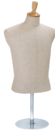
SG0980A-2C 芯地 Arm: なし Head: H-57 クリア Base: B-16 クリア S 高さ:59.0 B:89.0 W:77.0 肩幅 43.0 M 高さ:59.5 B:93.0 W:80.0 肩幅 44.0 L 高さ:60.0 B:95.0 W:81.0 肩幅 46.0