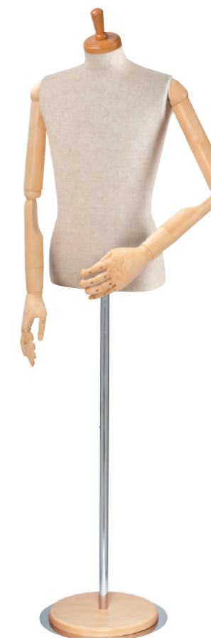
SG0630P-1C 本芯地 Head:H-30クリアφ10.5 Base:B-8P アイボリー Arm:SK0050-2アイボリー B:92 W:75 H90 高さ:67 肩幅:46.5