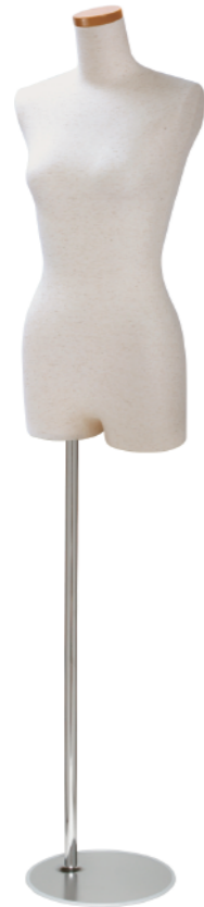
SL0850A-1N 芯地ニット Arm: なし Head: H-63 クリア Base: B-59 S 高さ:72.0 B:77.0 W:56.0 H:81.5 肩幅 34.5 M高さ:76.0 B:82.0 W:61.0 H:85.0 肩幅 38.0 L 高さ:76.0 B:88.0 W:67.5 H:91.5 肩幅 40.0