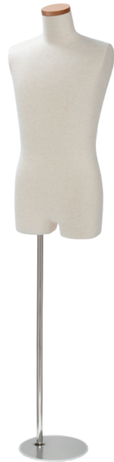
SG0950A-1N 芯地ニット Arm: なし Head: H-64 クリア Base: B-59 S 高さ:76.5 B:85.0 W:71.0 H:84.0 肩幅 38.0 M高さ:81.5 B:94.0 W:76.5 H:91.5 肩幅 41.0 L 高さ:83.5 B:97.0 W:77.0 H:92.5 肩幅 43.0