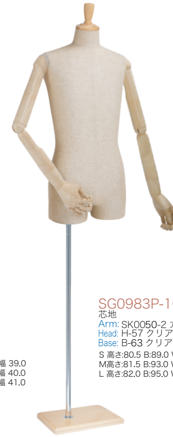
SG0983P-1C 芯地 Arm: SK0050-2 アイボリー Head: H-57 クリア Base: B-63 クリア S 高さ:80.5 B:89.0 W:77.0 H:93.0 肩幅 43.0 M 高さ:81.5 B:93.0 W:80.0 H:94.0 肩幅 46.0 L 高さ:82.0 B:95.0 W:81.0 H:95.0 肩幅 46.0