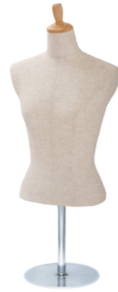
SL0880A-2C 芯地 Arm: なし Head: H-53 クリア Base: B-16 クリア S 高さ:55.0 B:77.0 W:57.0 肩幅 38.5 M 高さ:56.0 B:81.0 W:61.0 肩幅 39.5 L 高さ:57.0 B:82.0 W:63.0 肩幅 40.0