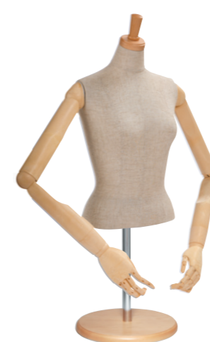
SL0530P-2C 本芯地 Head:H-27クリアφ7.5 Base:B-43P アイボリー Arm:SK0060-2 アイボリー B:80 W:58.5 高さ:52 肩幅:40.5