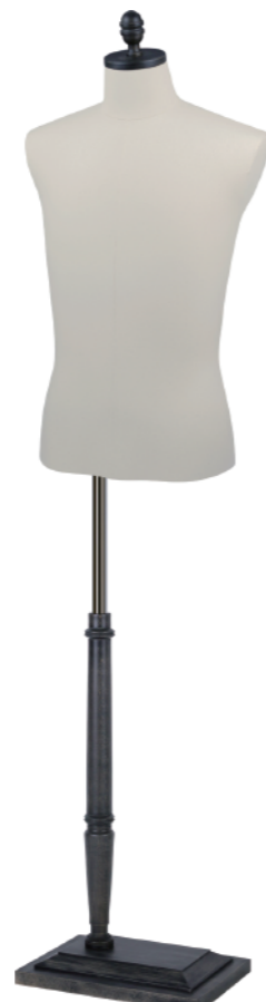
SG0981A-1KA カツラギ Head:H-100 アティーグブ ラックφ10.2 Base:B-200アティーグブ ラック B:93 W:80 H:94 高さ:68 肩幅:44 受注生産