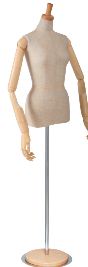
SL0530P-1C 本芯地 Head:H-27クリアφ7.5 Base:B-8P アイボリー Arm:SK0060-2 アイボリー B:80 W:58.5 H:82.5 高さ:65 肩幅:40.5