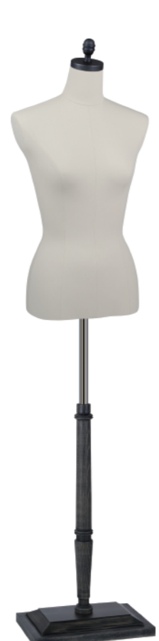
SL0881A-1KA カツラギ Head:H-101アティーグブ ラックφ8.4 Base:B-201アティーグブ ラック B:81 W:61 H:86.5高さ:63 肩幅:39.5 受注生産