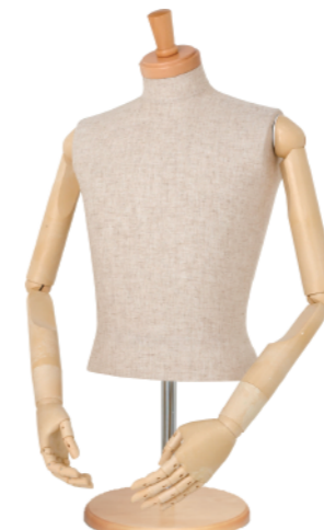
SG0630P-2C 本芯地 Head:H-30クリアφ10.5 Base:B-43P アイボリー Arm:SK0050-2アイボリー B:92 W:75 高さ:55 肩幅:46.5