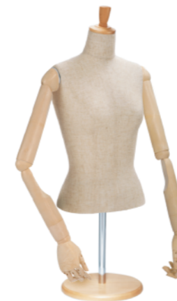
SL0883P-2C 芯地 Arm: SK0060-2 アイボリー Head: H-53 クリア Base: B-43P アイボリー S 高さ:55.0 B:77.0 W:57.0 肩幅 39.0 M 高さ:56.0 B:81.0 W:61.0 肩幅 40.0 L 高さ:57.0 B:83.0 W:63.0 肩幅 41.0