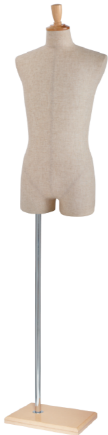
SG0980A-1C 芯地 Arm: なし Head: H-57 クリア Base: B-63 クリア S 高さ:80.0 B:89.0 W:77.0 H:93.0 肩幅 43.0 M 高さ:81.5 B:93.0 W:80.0 H:94.0 肩幅 44.0 L 高さ:82.0 B:95.0 W:81.0 H:95.0 肩幅 46.0