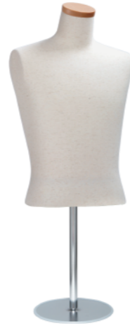
SG0950A-2N 芯地ニット Arm: なし Head: H-64 クリア Base: B-16B S 高さ:55.0 B:85.0 W:71.0 肩幅 38.0 M高さ:60.0 B:94.0 W:76.5 肩幅 41.0 L 高さ:60.0 B:97.0 W:77.0 肩幅 43.0