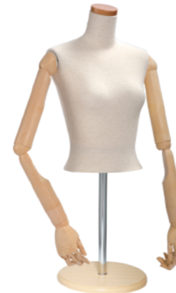
SL0850P-2N 芯地ニット Arm: SK0060-2 アイボリー Head: H-63 クリア Base: B-43P アイボリー S 高さ:53.0 B:77.0 W:56.0 肩幅 42.5 M高さ:56.0 B:82.0 W:61.0 肩幅 46.0 L 高さ:56.0 B:88.0 W:67.5 肩幅 48.0