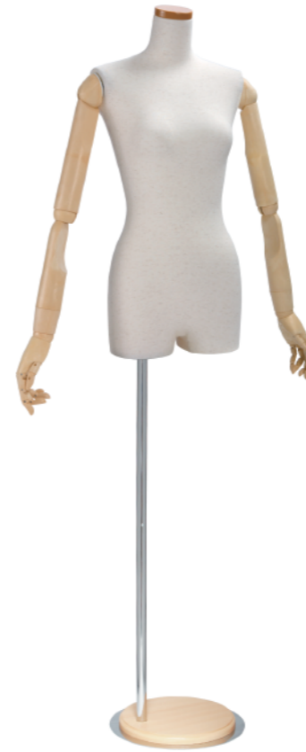
SL0850P-1N 芯地ニット Arm: SK0060-2 アイボリー Head: H-63 クリア Base: B-9P アイボリー S 高さ:72.0 B:77.0 W:56.0 H:81.5 肩幅 42.5 M高さ:76.0 B:82.0 W:61.0 H:85.0 肩幅 46.0 L 高さ:76.0 B:88.0 W:67.5 H:91.5 肩幅 48.0