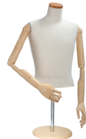
SG0950P-2N 芯地ニット Arm: SK0050-2 アイボリー Head: H-64 クリア Base: B-43P アイボリー S 高さ:55.0 B:85.0 W:71.0 肩幅 46.0 M高さ:60.0 B:94.0 W:76.5 肩幅 49.0 L 高さ:60.0 B:97.0 W:77.0 肩幅 51.0