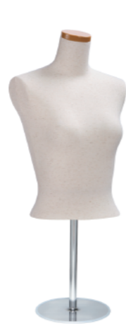
SL0850A-2N 芯地 Arm: なし Head: H-63 クリア Base: B-16B S 高さ:53.0 B:77.0 W:56.0 肩幅 34.5 M高さ:56.0 B:82.0 W:61.0 肩幅 38.0 L 高さ:56.0 B:88.0 W:67.5 肩幅 40.0