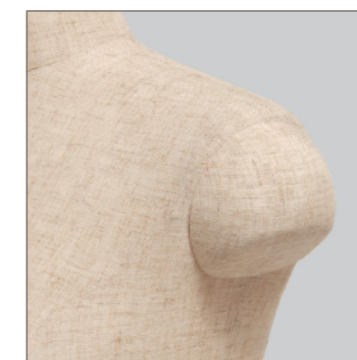
SK004 : Men's SK003 : Lady's

布貼りの場合は布地の指定の ご相談をお願いします。 ラッカー塗装の場合は塗装の ご指示をお願いします。