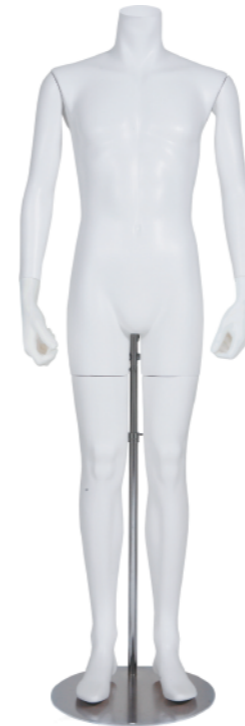
SGB006K-1W-RL ラッカー (白) Arm: 右直・左直 Head: なし Base: 専用丸スタンド 高さ :169 B:94.5 W:76 H:91 肩幅 50