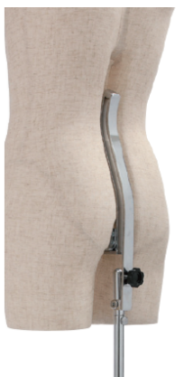
バックスタンド構造 傾き調整機能付き