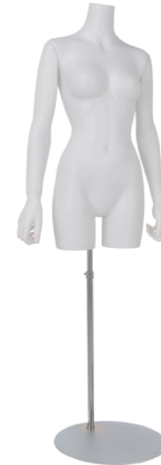
SLB001K-1W ラッカー (白) Arm: 右直・左直 Head: なし Base: 専用丸スタンド 高さ :83 B:82 W:57 H:85 肩幅 42