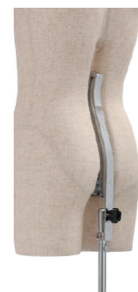
バックスタンド構造 傾き調整機能付き