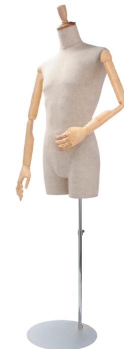
SGB007P-1C 芯地 Arm: SK0050-2 アイボリー Head: H-57 クリア Base: 専用丸スタンド 高さ :90 B:94 W:75 H:91 肩幅 54.5