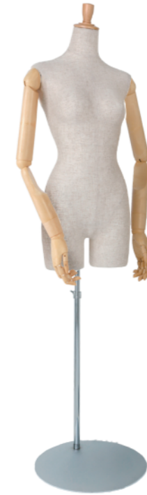
SLB003P-1C 芯地 Arm: SK0060-2 アイボリー Head: H-53 クリア Base: 専用丸スタンド 高さ :81 B:82 W:57 H:85 肩幅 47