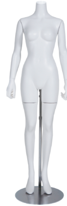
SLB002K-1W-RL ラッカー (白) Arm: 右直・左直 Head: なし Base: 専用丸スタンド 高さ :157 B:82 W:57 H:85 肩幅 42