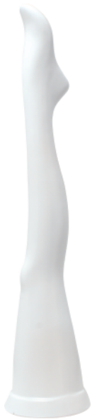
ST165 ラッカー(白) 高さ 94