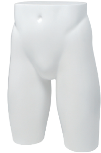
ST681 ラッカー (白) 高さ 53.5 股下 25.5 W:75 H:90