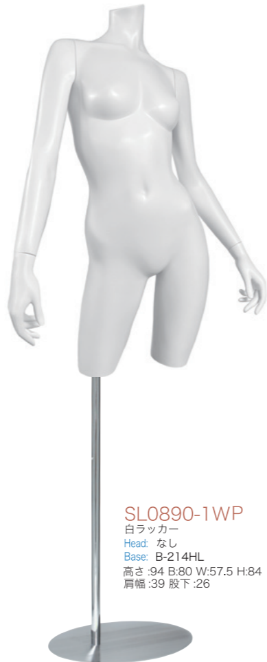
SL0890-1WP 白ラッカー Head: なし Base: B-214HL 高さ:94 B:80 W:57.5 H:84 肩幅:39 股下:26