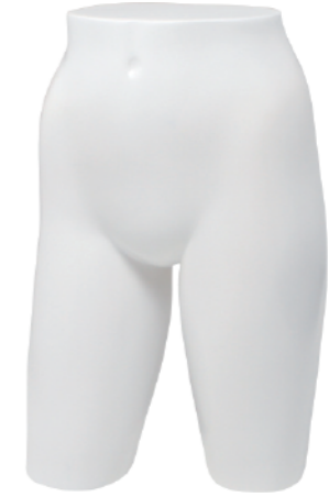
ST578 ラッカー (白) 高さ 49 股下 22.5 W:61 H:82