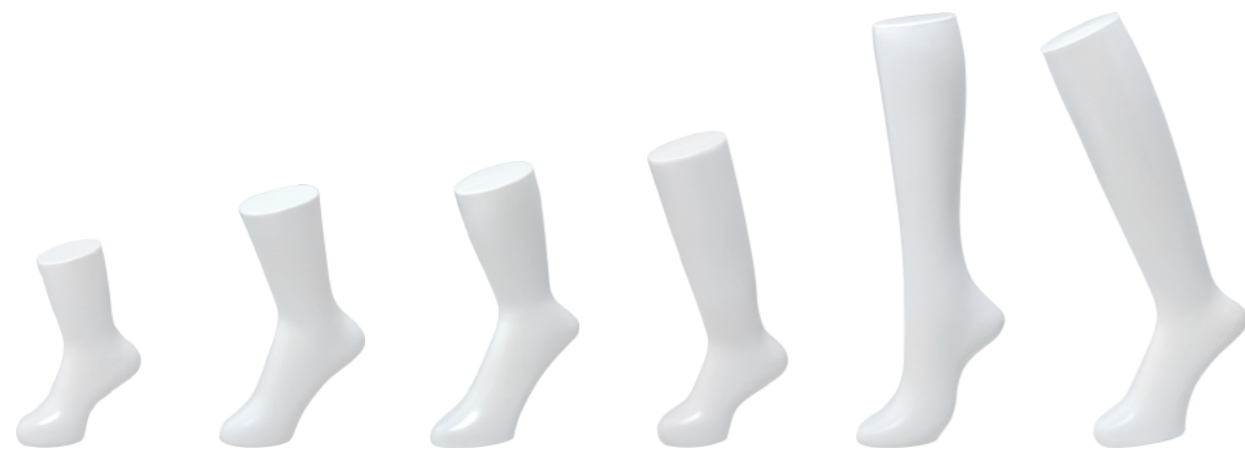
ST171 子供 ラッカー(白) 高さ 23