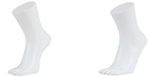
ST7004-R ラッカー(白) 右 高さ 23.5