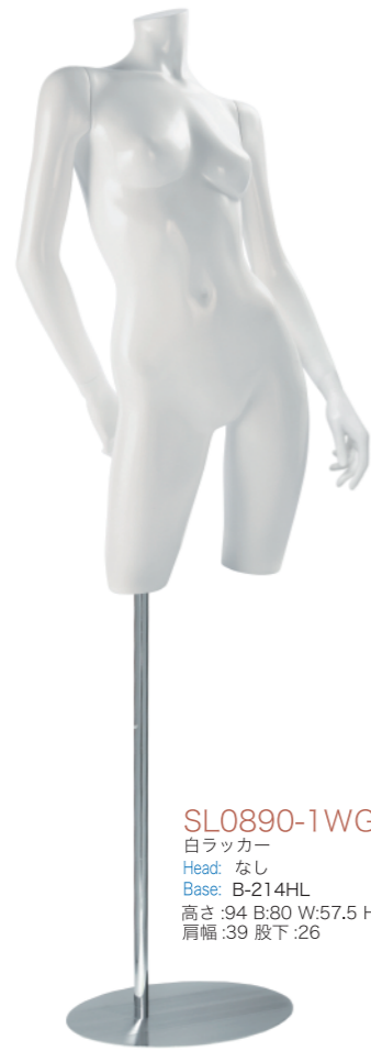
SL0890-1WG 白ラッカー Head: なし Base: B-214HL 高さ:94 B:80 W:57.5 H:84 肩幅:39 股下:26