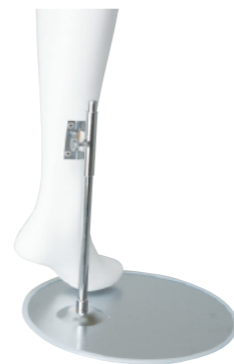
■ レッグスタンド ふくらはぎから支える構造 ですので、靴を履かせる時 に便利です。