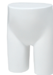
ST295 ラッカー (白) 高さ 28.5 股下 11 W:52 H:57