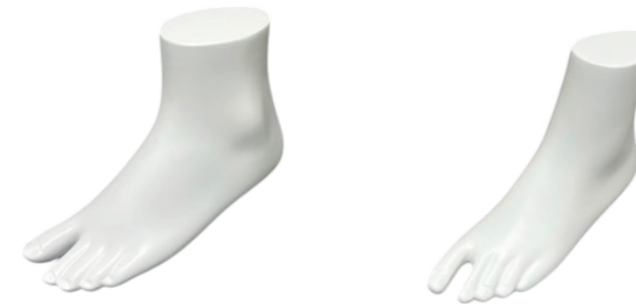
ST7032 ラッカー(白) 高さ 26.5 長さ24