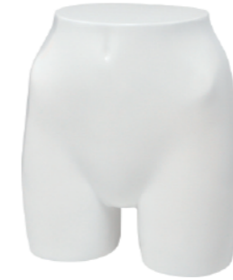
ST581 ラッカー (白) 高さ 33.5 股下 6.5 W:60 H:84