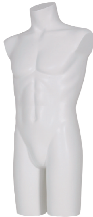
メンズ ST663 ラッカー (白) 高さ 96 肩幅 48 股下 20 B:93.5 W:75.5 H:89.5