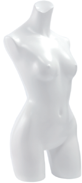
ST149 ラッカー (白) 高さ 80 肩幅 38 股下 12 B:79 W:57.5 H:83