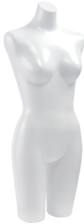
ST153 ラッカー (白) 高さ 93 肩幅 39 股下 24 B:86 W:64 H:89.5