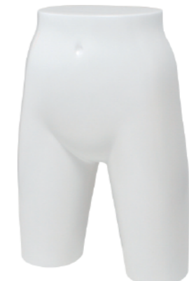
ST2915 ラッカー (白) 高さ 44 股下 18.5 W:58 H:77