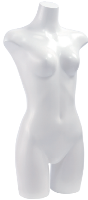
ST860 ラッカー (白) 高さ 83 肩幅 41 股下 12 B:82 W:61 H:85