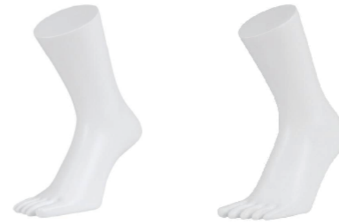
ST7003-R ラッカー(白) 右 高さ 30.5