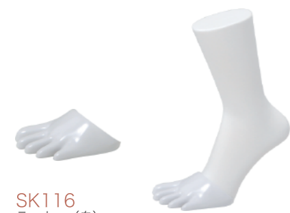
SK116 ラッカー(白) ST171,170,168の 専用パーツです。