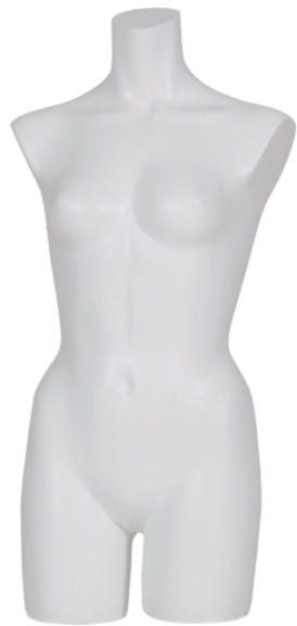
ST563 ラッカー (白) 高さ 78 肩幅 41 股下 10 B:82 W:59.5 H:83