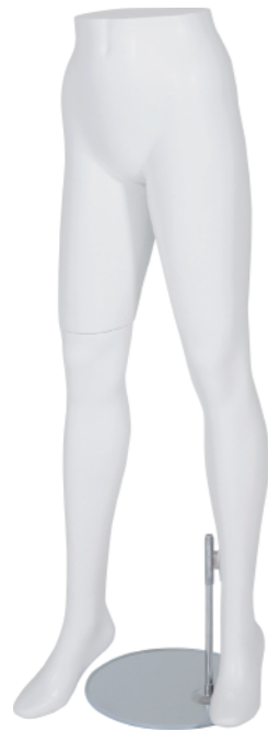
ST196 ラッカー (白) Base: B-121A 専用支柱 高さ 113 股下 87 W:63 H:82.5