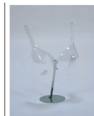
A 卓上ベースパーツ 本体受け金具 差し込み部分 卓上用ベース φ13cm クロームメッキ