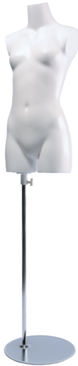
SC0820A-1W150G ラッカー(白) Base: B-59A 高さ:69.5 肩幅 35.0 B:70.0 W:56.0 H:77.0