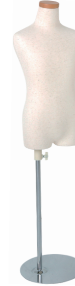
SC0122A-1N120 芯地ニット Head: H-71クリア Base: B-19A 高さ:54.0 肩幅 30.0 B:64.5 W:54.0 H:66.5