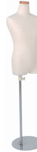
SC0122A-1N130 芯地ニット Head: H-71クリア Base: B-19B 高さ:55.0 肩幅 32.0 B:66.0 W:57.5 H:70.0