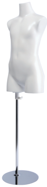
SC0820A-1W130 ラッカー(白) Base: B-19B 高さ:59.5 肩幅 33.0 B:64.0 W:55.0 H:71.5