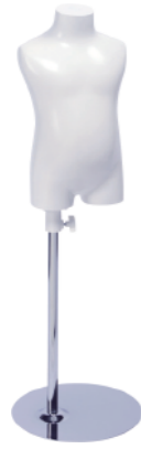
SC0120A-1W80 ラッカー(白) Base: B-19A-450 高さ:37.0 肩幅 23.0 B:43.0 W:48.5 H:50.0