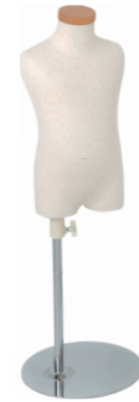
SC0122A-1N90 芯地ニット Head: H-71クリア Base: B-19A-450 高さ:40.0 肩幅 23.0 B:53.0 W:51.0 H:53.5