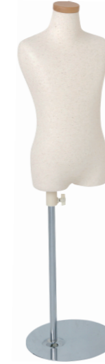
SC0122A-1N110 芯地ニット Head: H-71クリア Base: B-19A 高さ:49.0 肩幅 28.0 B:60.5 W:52.0 H:61.5