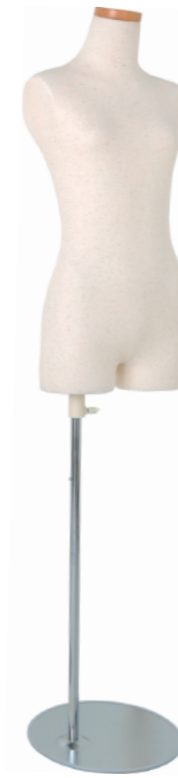
SC0830A-1N150G 芯地ニット Head: H-71クリア Base: B-59A 高さ:68.0 肩幅 34.5 B:70.0 W:55.0 H:76.0