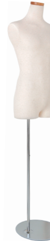
SC0830A-1N160B 芯地ニット Head: H-71クリア Base: B-59A 高さ:70.0 肩幅 39.5 B:77.0 W:64.0 H:83.0