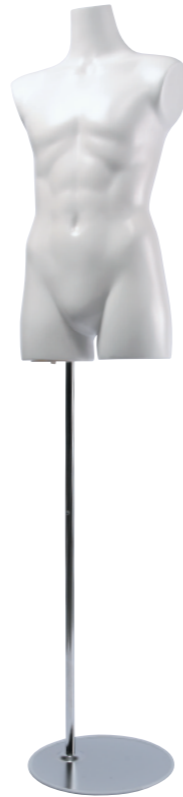
SC0820A-1W160B ラッカー(白) Base: B-59A 高さ:71.5 肩幅 40.5 B:77.5 W:64.0 H:84.0