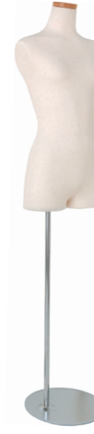
SC0830A-1N160G 芯地ニット Head: H-71クリア Base: B-59A 高さ:70.0 肩幅 39.0 B:76.0 W:61.5 H:82.0