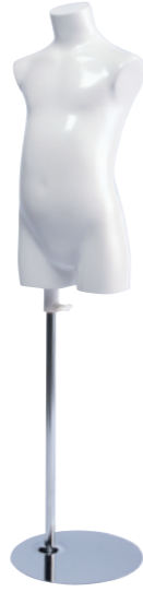
SC0820A-1W110 ラッカー(白) Base: B-19A 高さ:51.5 肩幅 28.0 B:55.0 W:51.0 H:59.5