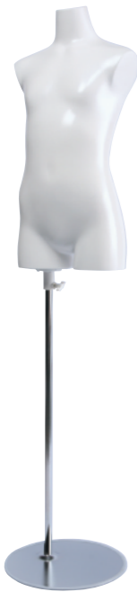
SC0820A-1W140 ラッカー(白) Base: B-59A-800 高さ:62.5 肩幅 35.5 B:68.0 W:59.0 H:74.0