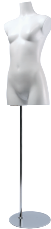
SC0820A-1W160G ラッカー(白) Base: B-59A 高さ:71.5 肩幅 39.0 B:76.0 W:63.0 H:83.5