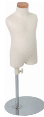
SC0122A-1N80 芯地ニット Head: H-71クリア Base: B-19A-450 高さ:37.0 肩幅 23.0 B:43.0 W:48.5 H:50.0