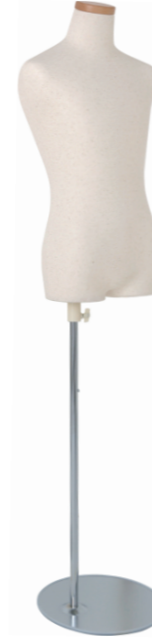
SC0122A-1N140 芯地ニット Head: H-71クリア Base: B-59A-800 高さ:60.0 肩幅 34.0 B:70.0 W:60.0 H:75.0