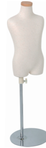
SC0122A-1N100 芯地ニット Head: H-71クリア Base: B-19A 高さ:44.0 肩幅 26.0 B:55.0 W:48.5 H:56.0