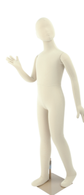
SM055-E130 ライクラアイボリー Base: 240 角ベース レッグスタンドタイプ 高:133 肩幅 33 股下 61 B:67 W:57 H:67