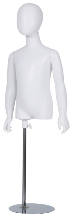
SC0810K-1W110-H ラッカー (白) Arm: 右直・左直 Head: オーバルヘッド Base: B-19A 高さ:62 B:60.5 W:52 H:61.5 肩幅 31