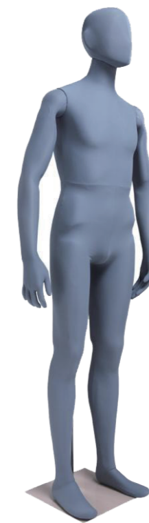
SM0531 グレー ライクラグレー Base: 330角ベース L型背面支柱