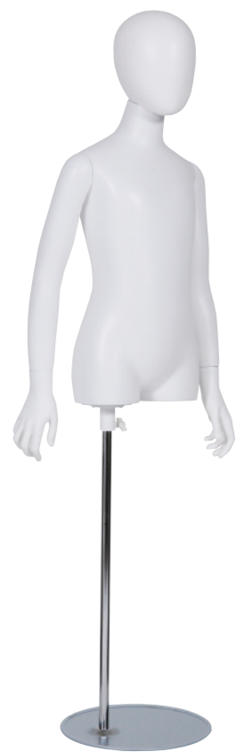
SC0810K-1W140-H ラッカー (白) Arm: 右直・左直 Head: オーバルヘッド Base: B-59A-800 高さ:75.5 B:67 W:57 H:74 肩幅 34