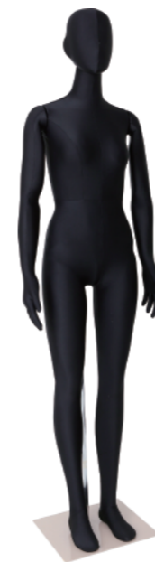
SM0532 黒 ライクラ黒 Base: 330角ベース L型背面支柱 高:172 肩幅 37 股下 84 B:80.5 W:60 H:85.5