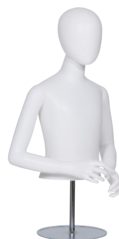
SC0810K-2W140-H ラッカー (白) Arm: 右曲・左曲 Head: オーバルヘッド Base: B-16A 高さ:59.5 B:67 W:57 肩幅 34