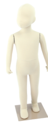
SM055-E90 ライクラアイボリー Base: 240 角ベース レッグスタンドタイプ 高:89 肩幅 27 股下 35 B:52 W:49 H:53