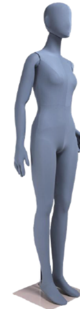
SM0532 グレー ライクラグレー Base: 330角ベース L型背面支柱