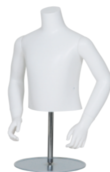
SC0810K-2W110 ラッカー (白) Arm: 右曲・左曲 Head: なし Base: B-16A 高さ:37.5 B:60.5 W:52 肩幅 31