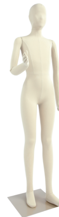
SM054-E160B ライクラアイボリー Base: 330 角ベース L型背面支柱 高:160 肩幅 36 股下 81 B:69 W:56 H:76