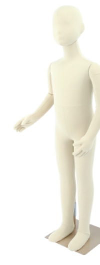
SM055-E110 ライクラアイボリー Base: 240 角ベース レッグスタンドタイプ 高:112 肩幅 29 股下 47 B:58 W:53 H:57