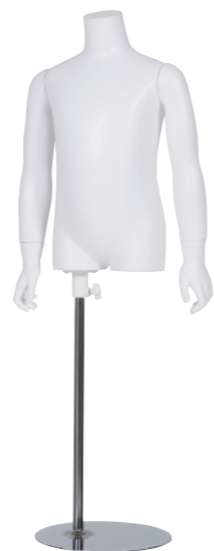
SC0810K-1W110 ラッカー (白) Arm: 右直・左直 Head: なし Base: B-19A 高さ:49 B:60.5 W:52 H:61.5 肩幅 31