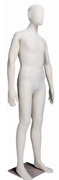
SM0531 アイボリー ライクラアイボリー Base: 330角ベース L型背面支柱