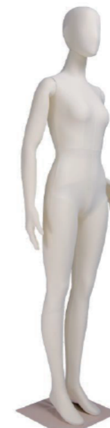
SM0532 アイボリー ライクラアイボリー Base: 330角ベース L型背面支柱