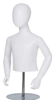
SC0810K-2W110-H ラッカー (白) Arm: 右曲・左曲 Head: オーバルヘッド Base: B-16A 高さ:50.5 B:60.5 W:52 肩幅 31