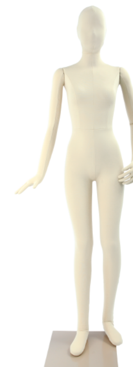
SM054-E160G ライクラアイボリー Base: 330 角ベース L型背面支柱 高:160 肩幅 36 股下 81 B:73 W:55 H:79.5