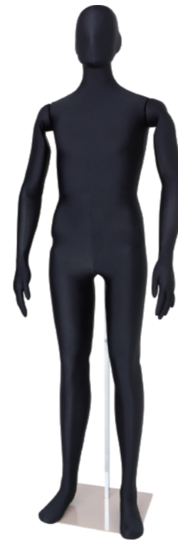
SM0531 黒 ライクラ黒 Base: 330角ベース L型背面支柱 高:180 肩幅 47 股下 88.5 B:92.5 W:75.5 H:93.5

可動する部分にスリットを入れ、よりポージングがスムーズになりました。 可動域が大きくなり、より一層リアルなポージングを表現いたします。 新型のウレタンマネキンの縫製されている布地はストレッチ性の 高い素材を採用することにより、 従来品より操作性と耐久性がアップいたしました。