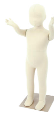
SM055-E80 ライクラアイボリー Base: 240 角ベース レッグスタンドタイプ 高:81 肩幅 25 股下 27.5 B:50 W:48.5 H:51