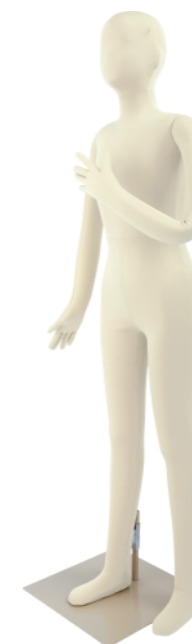
SM055-E140 ライクラアイボリー Base: 330 角ベース レッグスタンドタイプ 高:142 肩幅 32 股下 67 B:67 W:58.5 H:71