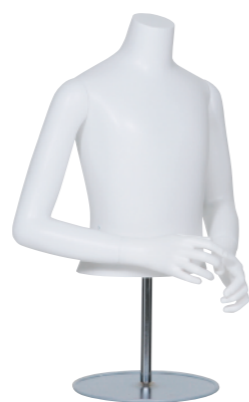
SC0810K-2W140 ラッカー (白) Arm: 右曲・左曲 Head: なし Base: B-16A 高さ:45 B:67 W:57 肩幅 34