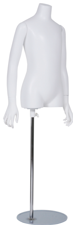
SC0810K-1W140 ラッカー (白) Arm: 右直・左直 Head: なし Base: B-59A-800 高さ:61 B:67 W:57 H:74 肩幅 34