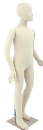
SM055-E120 ライクラアイボリー Base: 240 角ベース レッグスタンドタイプ 高:123 肩幅 32 股下 55 B:63 W:55 H:63