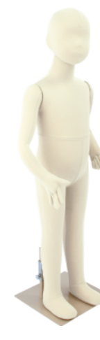
SM055-E100 ライクラアイボリー Base: 240 角ベース レッグスタンドタイプ 高:101 肩幅 28 股下 39 B:53 W:51 H:55